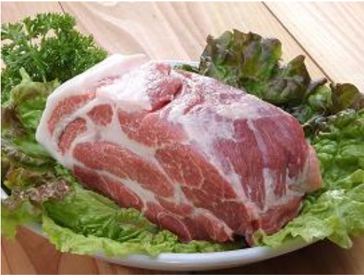
瀬戸のもち豚せと姫